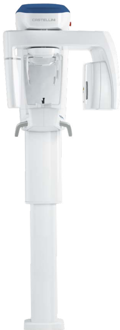
X RADIUS COMPACT 2D/3D