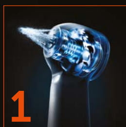
1 Kleština DURAPOWER CHUCK® pro delší životnost

Patentovaná technologie DURAPOWER CHUCK® vylepšuje funkci upínání kleštiny. Jednoduše uživatelsky vyměnitelný rotor.