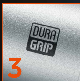
3 Titanový povrch DURAGRIP® pro komfort lékaře