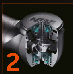
2 Systém QUICK STOP pro bezpečí pacienta