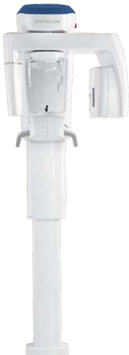
X RADIUS COMPACT 2D/3D