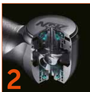
2 Systém QUICK STOP pro bezpečí pacienta