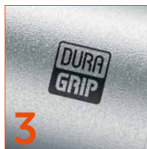
3 Titanový povrch DURAGRIP® pro komfort lékaře