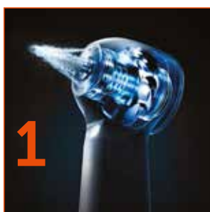
1 Kleština DURAPOWER CHUCK® pro delší životnost

Patentovaná technologie DURAPOWER CHUCK® vylepšuje funkci upínání kleštiny. Jednoduše uživatelsky vyměnitelný rotor.