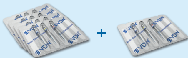
Rotate ass. (MSTVROT331AST/MSTVROT325AST/MSTVROT321AST), 3 ks v blistru. Číslo nabídky 4 + 1: CEEV007