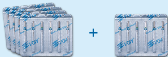
Mtwo NiTi ass. (V040230021456/V040230021457/V040230025230/ V040230025456/V040230025457/V040236025203/V040234025246), 6 ks v blistru. Číslo nabídky 4 + 1: CEEV009