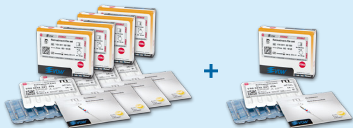
Mtwo NiTi Retreatment (V040232021), 6 ks v blistru. Číslo nabídky 4 + 1: CEEV0010

Pro cenovou nabídku kontaktujte svého prodejce.