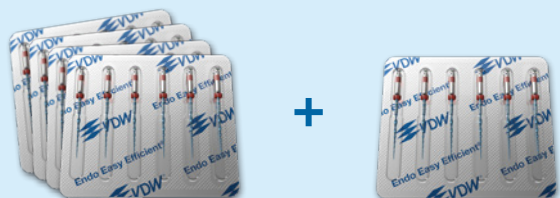
Reciproc Blue (V040252031/21/25) 6 ks v blistru. Číslo nabídky 4 + 1: CEEV005

Pro cenovou nabídku kontaktujte svého prodejce.