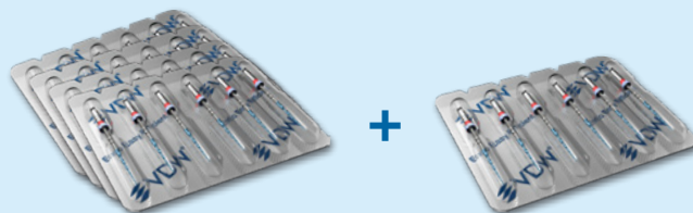
Rotate (MSTVROT621525/MSTVROT621520/MSTVROT625415/ MSTVROT621425/MSTVROT625425/MSTVROT621415/MSTVROT631415/ MSTVROT621625/MSTVROT631625/MSTVROT631520/MSTVROT631425/ MSTVROT625625/MSTVROT625520), 6 ks v blistru. a/nebo Rotate Retreatment (MSTVROT621525), 6 ks v blistru. Číslo nabídky 4 + 1: CEEV006