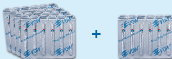
Mtwo NiTi Taper 04/05/06/07 (V0402340210/250; V0402350210/250; V0402360210/250; V0402370210/250) 6 ks v blistru. Číslo nabídky 4 + 1: CEEV0011